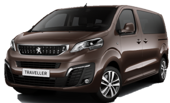
Brun Rich Oak