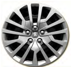
Enjoliveurs Full Cover 17"