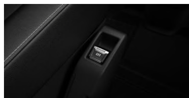
Frein de stationnement électrique

(2) Sur moteurs €6.3 et électrique uniquement