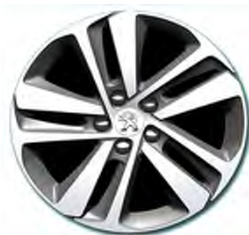
Jantes alliage 17" PHOENIX