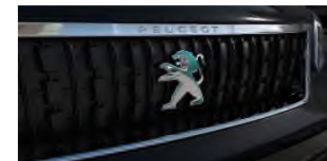
Calandre spécifique avec Lion Dichroïque