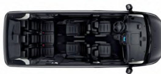
Configuration 7 places (AL35)