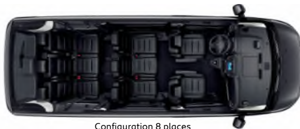
Configuration 8 places