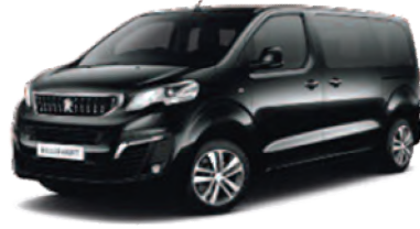
Noir Perla Nera