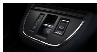
20D V1.0 4/21 Push multimode