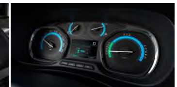
Combiné spécifique électrique