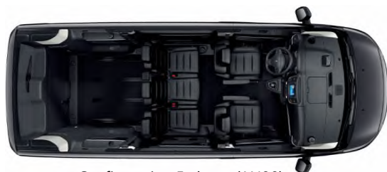
Configuration 5 places (AN00)